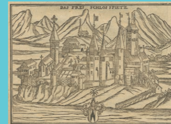
«DAS FREI SCHLOSS SPIETZ», Holzschnitt (Detail von S. 770) aus Sebastian Münsters Cosmographia von 1628, aus dem Schlossarchiv Stiftung Schloss Spiez