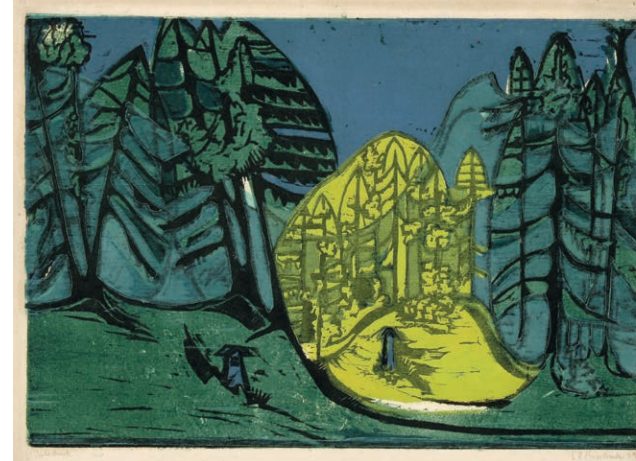
Ernst Ludwig Kirchner Waldfriedhof am Abend, 1933 Farbholzschnitt, 35 x 50 cm, Sammlung EWK

L'exposition présente une cinquantaine de gravures, aquarelles et dessins de Ernst Ludwig Kirchner (1880 Aschaffenburg – 1938 Davos) provenant de la vaste collection de l'éditeur et marchand d'art Eberhard W. Kornfeld. Les œuvres montrées ici retracent les principales périodes de création du peintre expressionniste remarquable que fut Kirchner, allant de la fondation du groupe d'artistes «Die Brücke» à Dresde jusqu'aux montagnes des Grisons à Davos, en passant par les événements vécus dans la trépidante ville de Berlin juste avant la Première Guerre mondiale. Une place particulière est accordée à la gravure sur bois qui a servi à Kirchner de véritable champ d'expérimentation pour son style expressionniste. La diversité des thèmes abordés est une autre composante de son œuvre où se côtoient des nus et des portraits, mais aussi le monde des variétés, des paysages et des vues de villes.