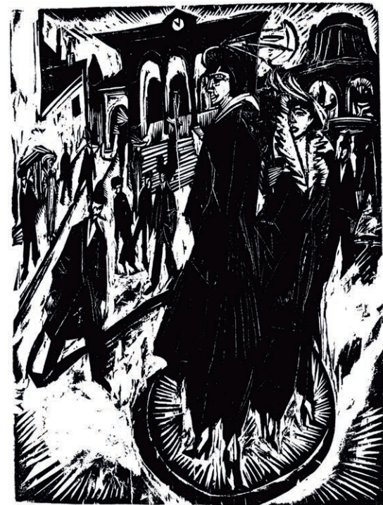
Ernst Ludwig Kirchner Frauen am Potsdamer Platz, 1914 Holzschnitt, 51/52 x 37,5 cm, Sammlung EWK