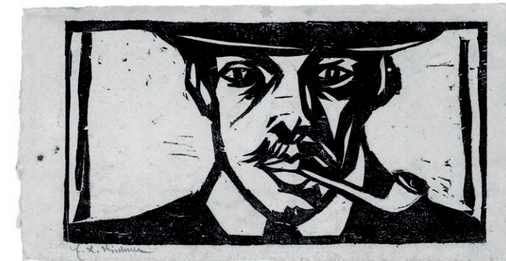
Ernst Ludwig Kirchner, Selbstbildnis mit Pfeife, 1905/06, Holzschnitt, 16,8 x 24,9 cm, Sammlung EWK