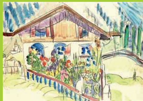
Ernst Ludwig Kirchner Das Wildbodenhaus 1924/25 Aquarell über Vorzeichnung aus Kohle 34 x 48,4 cm Sammlung EWK

Ab 6 Jahren Eine Anmeldung ist erforderlich. Die Platzzahl ist beschränkt. Dauer: 2 Stunden Kosten: CHF 5.00