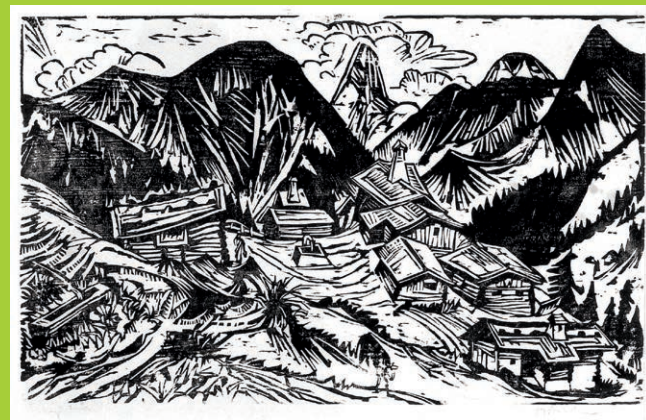
Ernst Ludwig Kirchner Stafelalp, 1917 Holzschnitt, 44,5 x 57 cm, Sammlung EWK

In Zusammenarbeit mit der Volkshochschule Spiez-Niedersimmental Abendkasse CHF 15.00