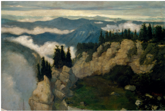
Ernst Kreidolf Nebelmeer, undatiert, Öl auf Leinwand, 56 x 83,5 cm Kunstmuseum Bern, Verein Ernst Kreidolf

«Zeichnen Sie nur fleissig nach der Natur, wie ich es in meinen jungen Jahren auch gemacht habe, dann entwickelt sich die Ausdrucksfähigkeit von selbst.»*