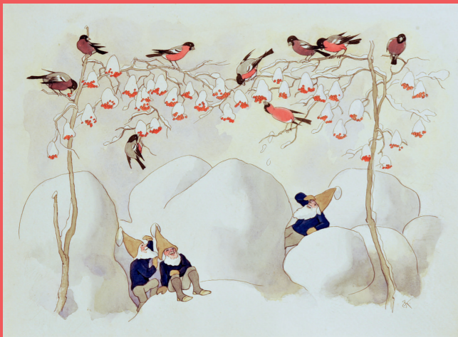
Ernst Kreidolf, Wintermärchen: Bei den Gimpeln, vor 1924 Tusche (Feder und Pinsel), Aquarell auf Papier auf Karton 25,7 x 33,8 cm Kunstmuseum Bern, Verein Ernst Kreidolf © 2017 ProLitteris, Zürich