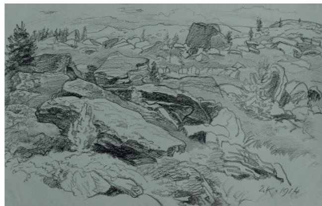
Ernst Kreidolf Bergsturzgebiet (Engadin), 1914, Kohle, 17 x 26,5 cm, Kunstmuseum Bern, Verein Ernst Kreidolf © 2017 ProLitteris, Zürich

Finalement, une attention toute particulière est vouée aux documents originaux conservés à la Bibliothèque de la Bourgeoisie de Berne. Des lettres et des photos faisant notamment partie de la succession écrite qui y est conservée, complètent l'image complexe de l'artiste et de sa perception des Alpes.