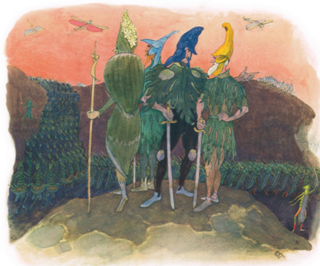
Ernst Kreidolf Alpenblumenmärchen: Eisenhüte, Rittersporn und Germen, 1918/19 Aquarell, 31,5 x 39,5 cm, Kunstmuseum Bern © 2017 ProLitteris, Zürich

«Apply yourself to drawing from nature, as I did in my youth, and expressiveness will develop of its own accord.»*