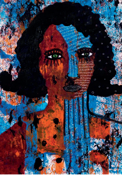
Dorota Solarska, geb. 1980 Dark, 2023 Mischtechnik auf Papier, 40.5 x 29.5 cm. © Kunstwerkstatt Waldau

«Die wirkliche Kunst ist immer dort, wo man sie nicht erwartet!»