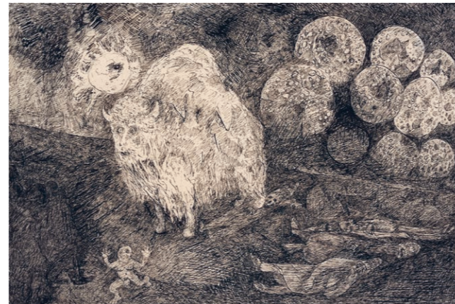
Friedrich Dürrenmatt, Weltstier, 1975, Tusche (Feder) auf Papier, 31.6 x 46.5 cm Sammlung Centre Dürrenmatt Neuchâtel