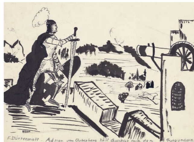
Friedrich Dürrenmatt, Adrian von Bubenberg hält Ausschau nach den Burgundern, 1934 Tusche auf Papier, 25.3 x 33 cm, Sammlungen Pestalozzianum, © CDN/Schweizerische Eidgenossenschaft