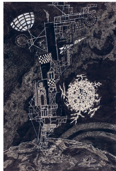
Friedrich Dürrenmatt, Turmbau III 1968, Tusche (Feder) auf Papier, 44.9 x 30 cm Sammlung Centre Dürrenmatt Neuchâtel

Les tableaux et dessins de Dürrenmatt s'inscrivent dans un contexte de références historiques, scientifiques, théologiques et éthiques. Grâce à la perspective globale adoptée, l'exposition permet de mieux comprendre la complémentarité de la créativité figurative et littéraire de Friedrich Dürrenmatt.