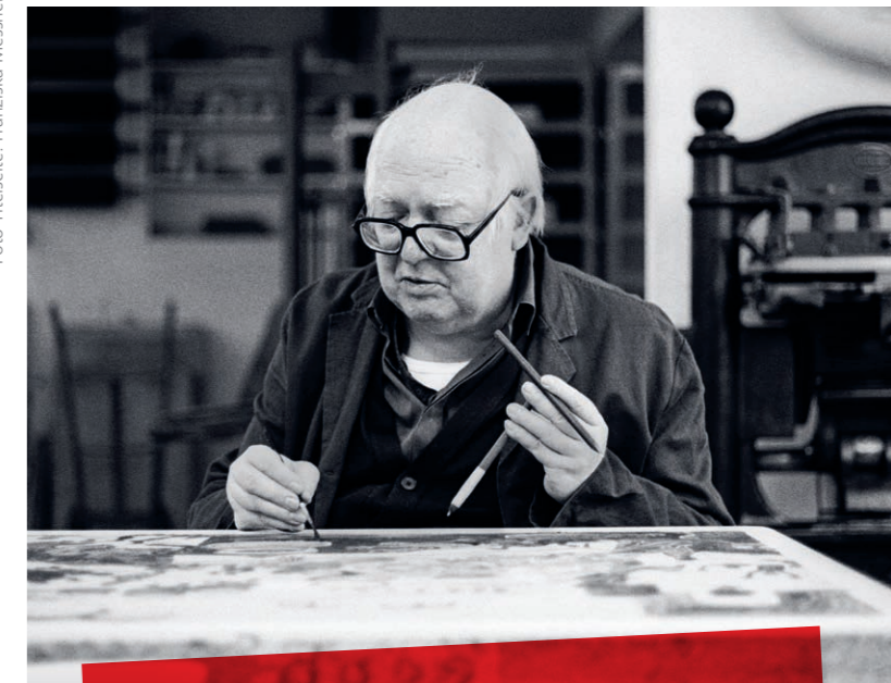
Grafik: Hannes Saxer, Bern