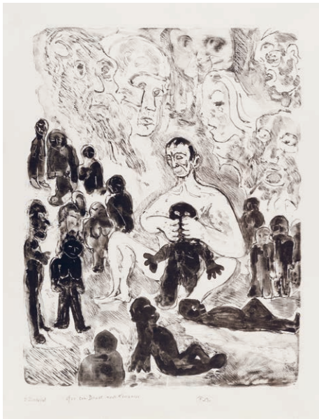
Friedrich Dürrenmatt, Prometheus, Menschen formend ca. 1988, Lithografie, 65.5 x 50 cm Sammlung Centre Dürrenmatt Neuchâtel