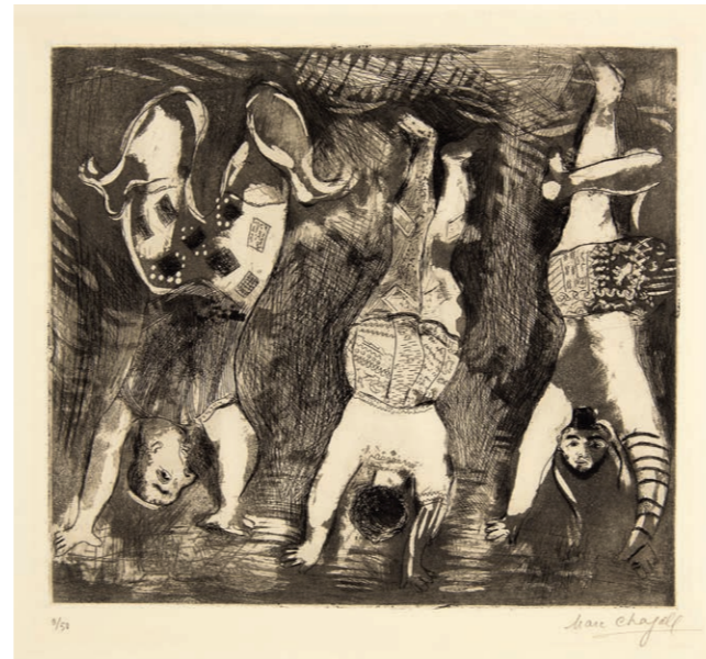
Marc Chagall Drei Akrobaten 1923, Radierung und Aquatinta, 34,2 x 37,3 cm Sammlung EWK

“I chose painting because it was as essential for me as food. It seemed to me like a window through which I could have taken flight toward another world.”