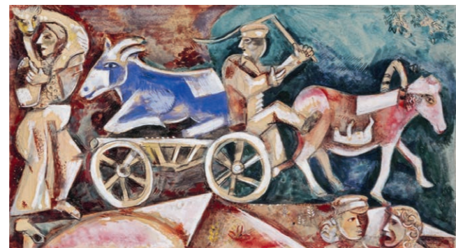
Marc Chagall Der Viehhändler 1912, Gouache, 26,2 x 47 cm Sammlung EWK