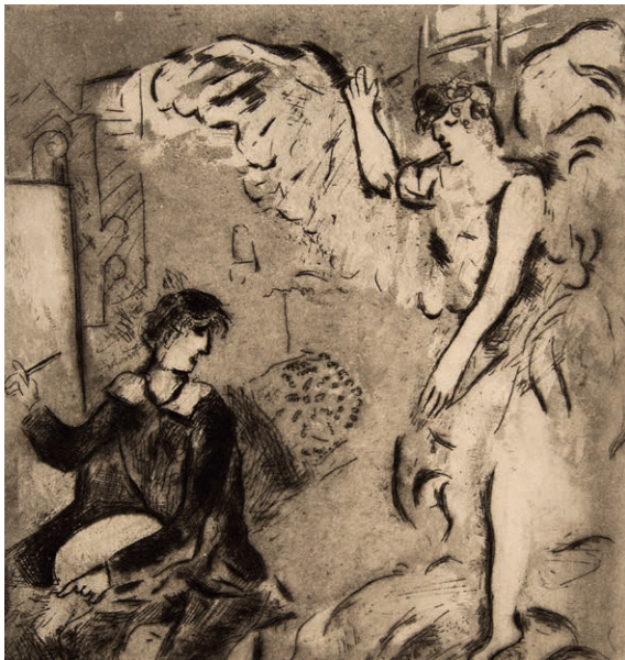
Marc Chagall Die Erscheinung I (Ausschnitt) 1924/25, Radierung und Aquatinta, 37,2 x 27,3 cm Sammlung EWK

«Ich wählte die Malerei, denn sie war mir genauso unentbehrlich wie alle Nahrung. Sie erschien mir wie ein Fenster, durch welches ich in eine andere Welt davonflog.»